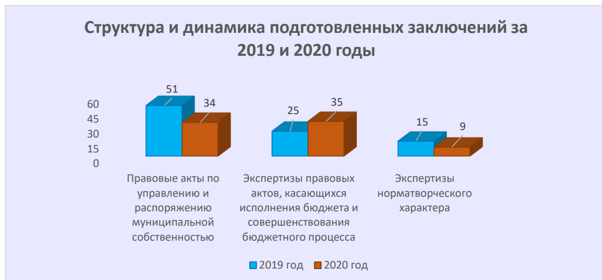
Диаграмма № 4

Структура подготовленных заключений представлена на диаграмме № 4.