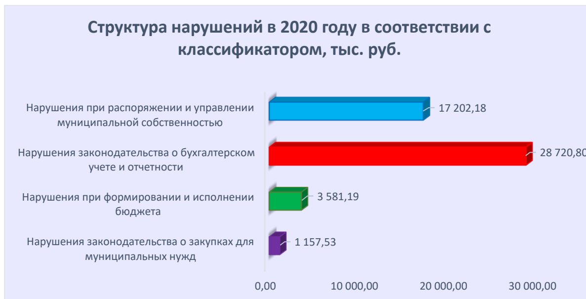
Диаграмма № 3